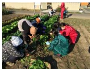
ほうれん草の収穫